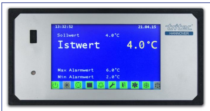
Benutzerfreundlich, intuitiv bedienbar