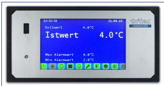
Benutzerfreundlich, intuitiv bedienbar