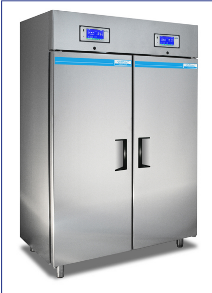
(Abb. DIN-konforme Ausstattung)